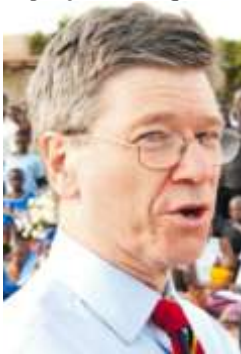
Jeffrey Sachs.

El afamado economista estadounidense Jeffrey Sachs ha concluido que Itaipú ya pagó todas sus deudas y que el Brasil debería devolver a Paraguay más de US$ 5.000 millones. El Poder Ejecutivo ahora pidió al profesional que también calcule cuánto dinero adic